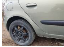
Renault Clio 1050 €