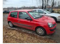
Renault Clio 850 €