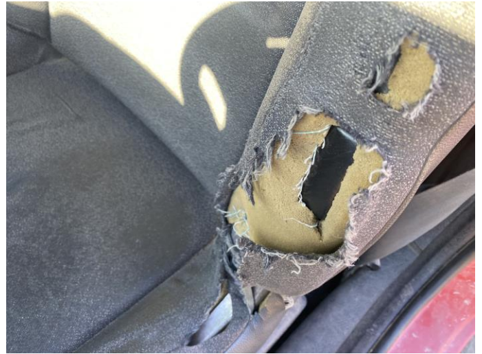
Attēls Nr. 8