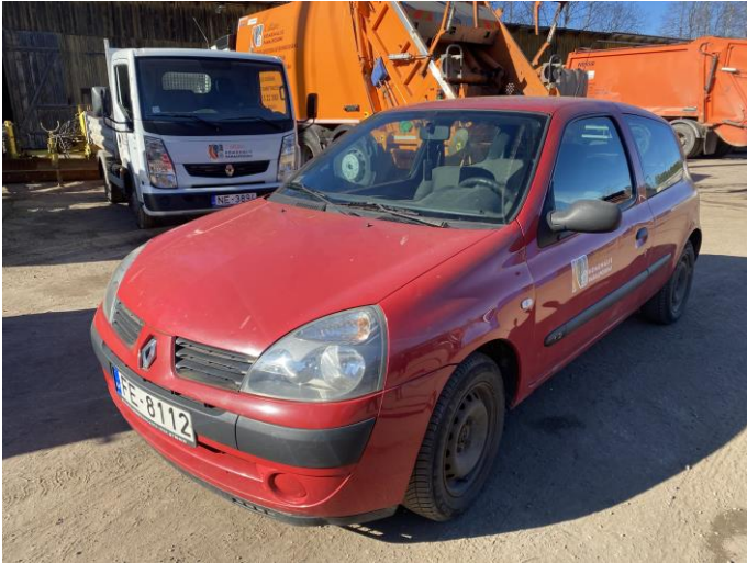
Attēls Nr. 1