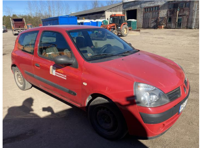
Attēls Nr. 2