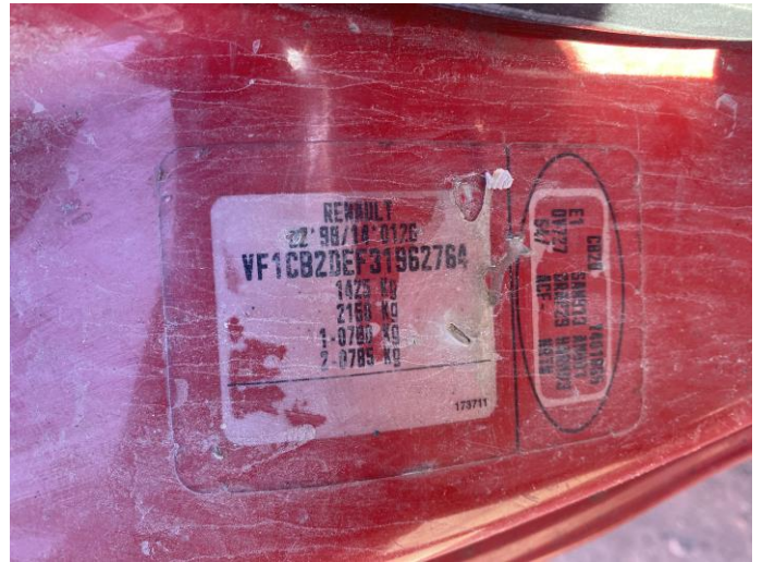
Attēls Nr. 10