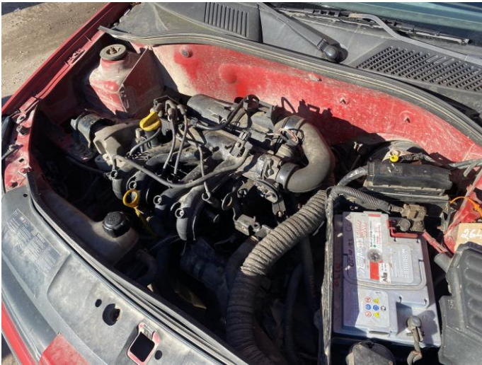
Attēls Nr. 9