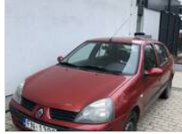
Renault Clio 950 €