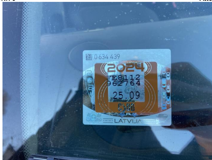
Attēls Nr. 11