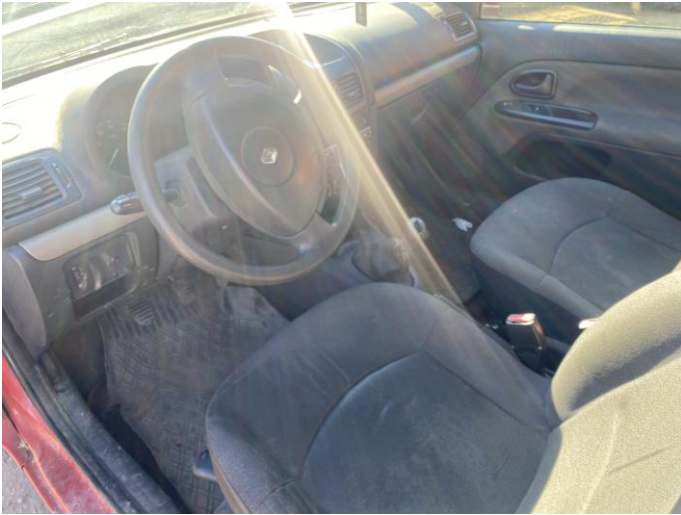
Attēls Nr. 7