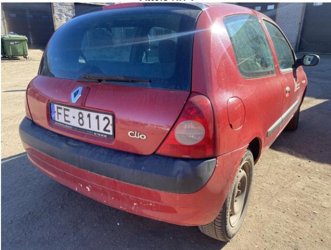
Attēls Nr. 3