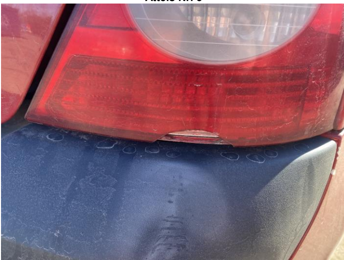
Attēls Nr. 5